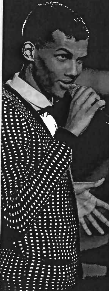
L'auteur-compositeur-interprète d'origine rwandaise Paul Van Haver s'est choisi comme nom de scène Stromae, maestro en verlan.

Ce Belge de 25 ans est une belle surprise musicale. Sa chanson Alors on danse flirte depuis des semaines avec les trois premières places du Top 50.