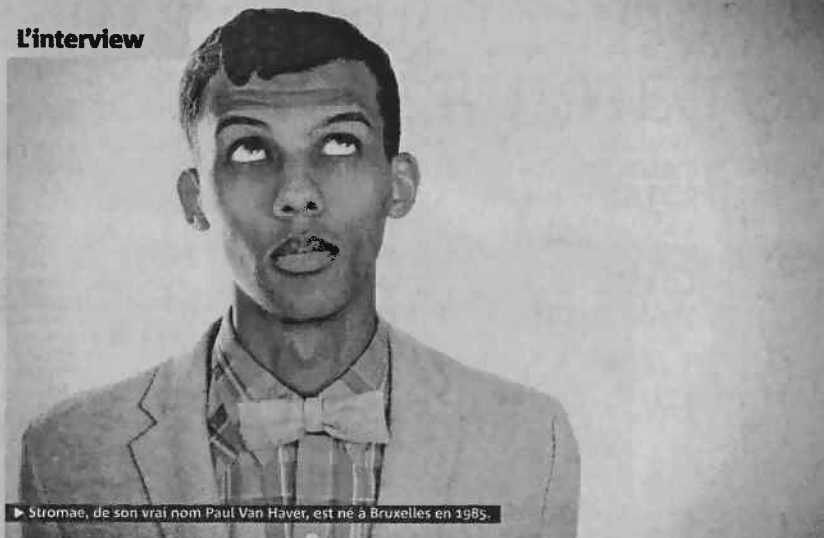
► Stromae, de son vrai nom Paul Van Haver, est né à Bruxelles en 1985.

► Après le carton du tube "Alors on danse", le chanteur belge d'origine rwandaise publie Cheese , un premier album surprenant à la croisée de l'électro et de la chanson ► Rencontre avec un artiste singulier